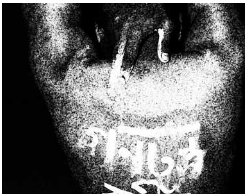
DESH

do 01.12.11 / 20.00 / Concertzaal DESH / Akram Khan Company Akram Khan portretteert in deze solo het leven in zijn thuisland Bangladesh. Hij zet lichaam en stem in om een reeks bekende personages uit het dagelijkse leven van zijn land op te voeren. Het scènebeeld is van de Chinese ontwerper Tim Yip, die een Oscar won voor zijn scenografie in de film Crouching Tiger, Hidden Dragon .