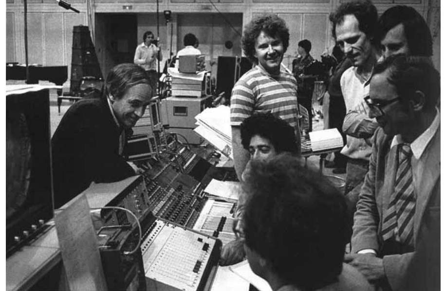
Pierre Boulez en de technische ploeg van het Ircam