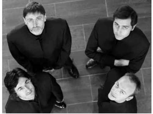
Danel Kwartet © D. Trillo