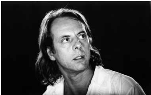
Karlheinz Stockhausen