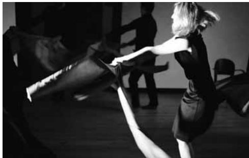
Waar is mijn ziel?