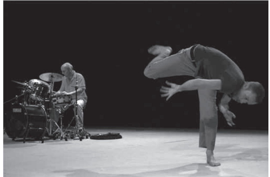
Drum & Dance

De tweede editie van het COME ON!-festival sluit af met een grote BEAT IT! Happening. Gerenommeerde percussionisten als Terry Bozzio, Theodor Milkov en Miquel Bernat palmen een dag lang het Concertgebouw in en nemen de bezoekers op sleeptouw in drie contrastrijke percussiewandelingen.