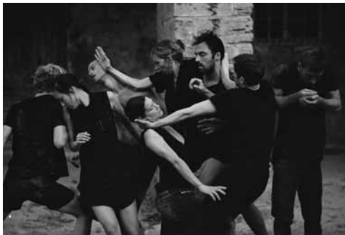
En Atendant