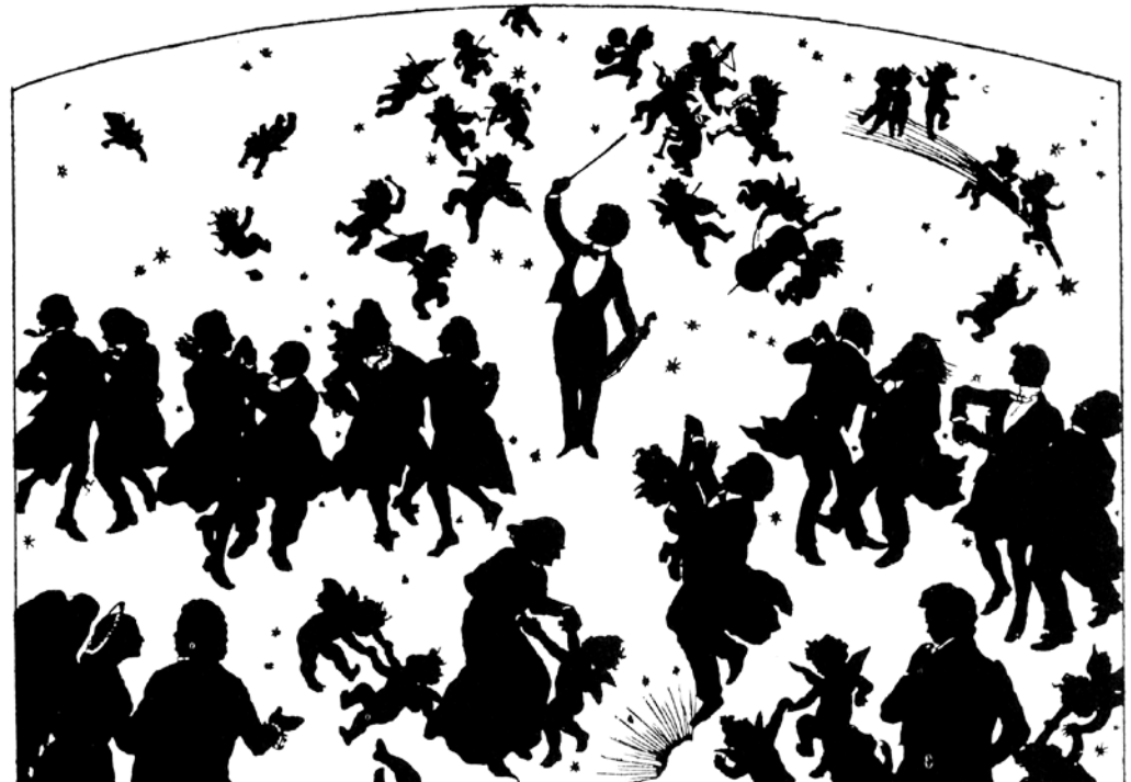
Böhlers silhouettes of Strauss conducting waltzes in heaven. Brahms and Mozart are among the dancers.