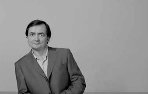
Pierre-Laurent Aimard