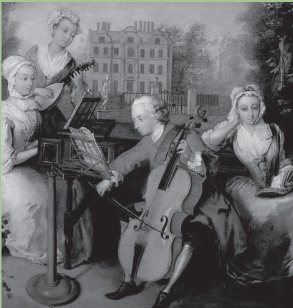
Frederick, Prince of Wales and his Sisters: A Music Party by Philippe Mercier, 1733 (National Portrait Gallery, London)