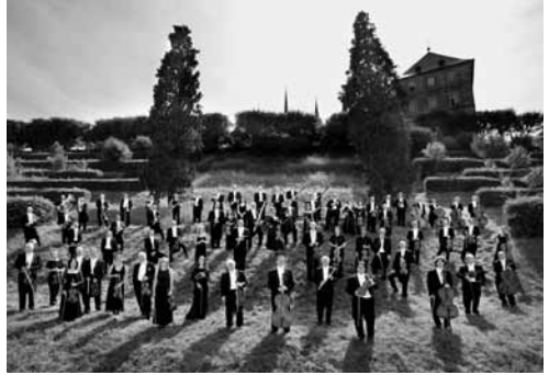
Bamberger Symphoniker