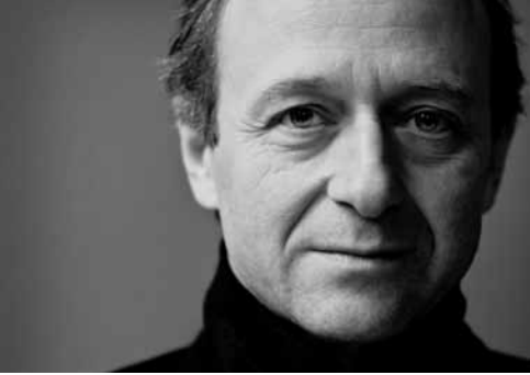
Iván Fischer