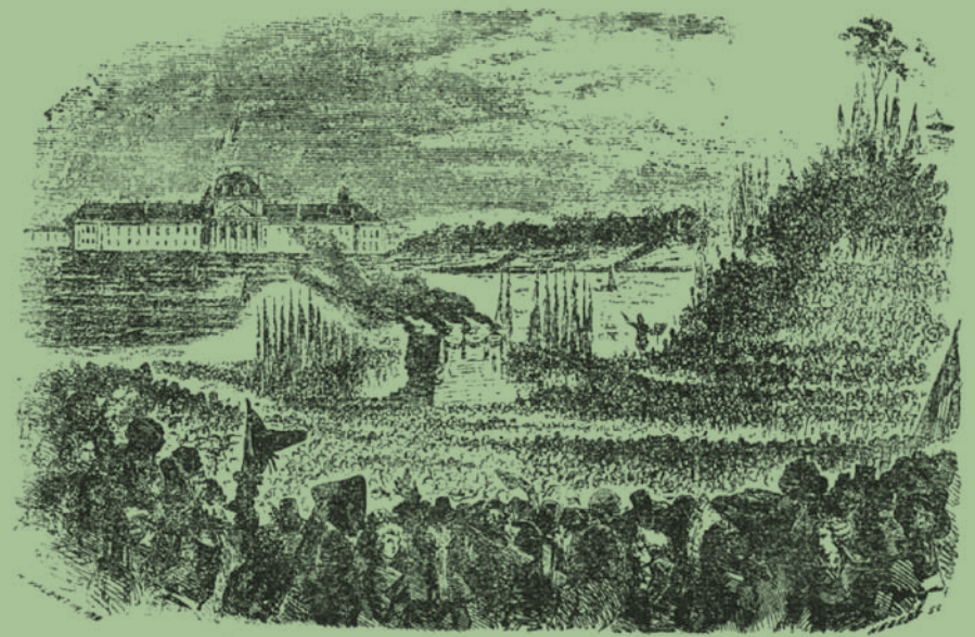
La Fête de l'Être suprême (8 juin 1794). (gravure de l'époque)