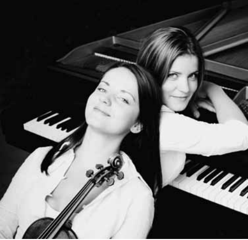
Baiba en Lauma Skride