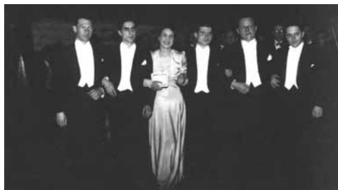
De laureaten van de Ysaÿewedstrijd in 1938.