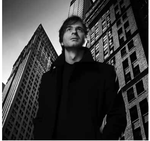
Piotr Anderszewski