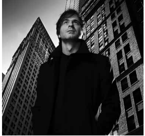
Piotr Anderszewski © Marc Ribes

wo 03.11.10 / 20.00 & do 04.11.2010 / 15.00 / Kamermuziekzaal