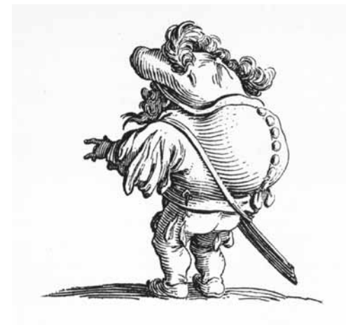
Scarbo, tekening van J. Callot