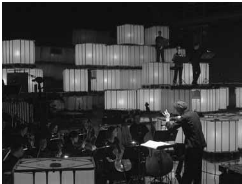
Ensemble modern