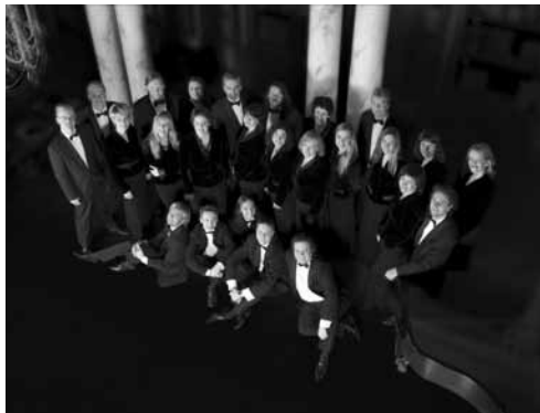
Lets Radio Koor