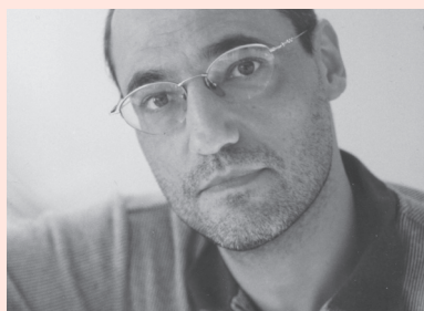
Andreas Staier