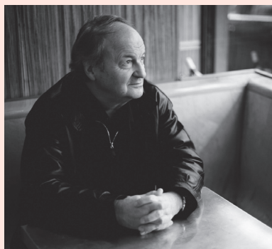
Michel Tabachnik