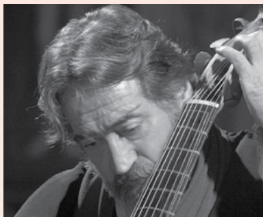
Jordi Savall