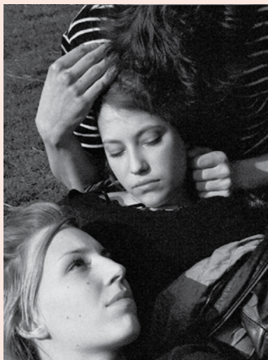
Die Entführung aus dem Paradies © Herman Sorgeloos