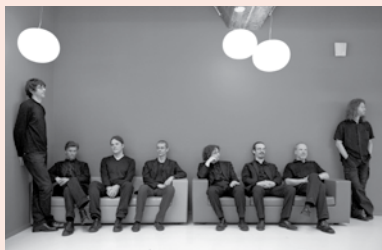
Spectra Ensemble

2009 is het internationale jaar van de sterrenkunde. Vooral de ster HD 129929 is inspiratiebron voor het grootschalige werk Sternenrest voor video, elektrische gitaar, glaspercussie, ensemble en elektronica van Willem Boogman. Centraal staat het Wave Field Synthesis-systeem, liefst 192 boxen die het publiek omringen. Talea en Solo pour deux van spectralist Gérard Grisey bereiden u voor op een wervelende klankervaring.