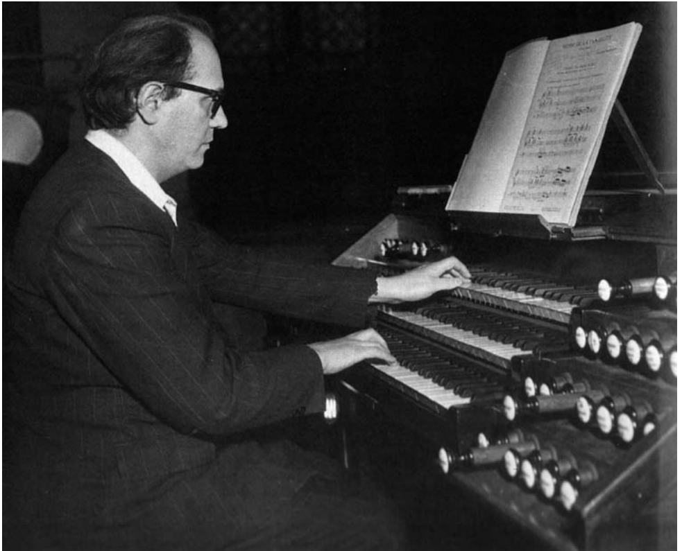
Messiaen aan het orgel