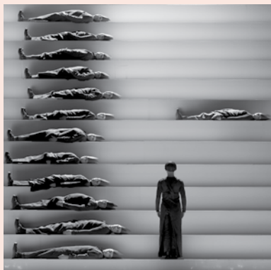
Operation: Orfeo