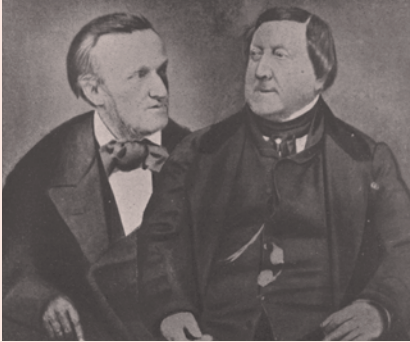
Wagner en Rossini

blijf te Passy kopen en een appartement huren in de Rue de la Chaussée d'Antin in Parijs. Daar leidde hij samen met Olympe een allesbehalve teruggetrokken leven.