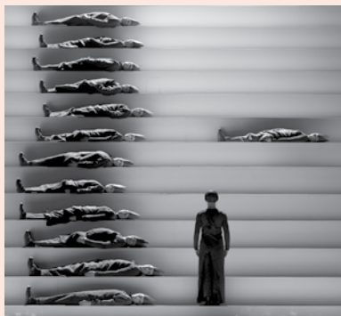
Operation: Orfeo