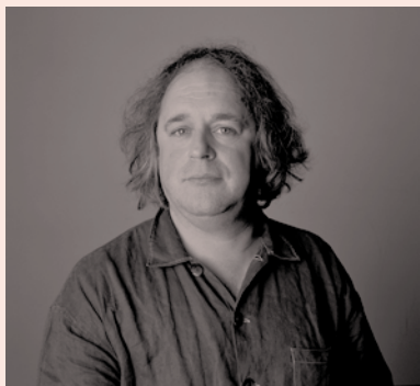
Marcel Ponselee