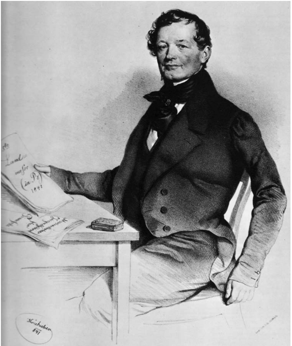
Anton Diabelli, lithografie van Joseph Kriehuber (Historisch Museum Wenen)