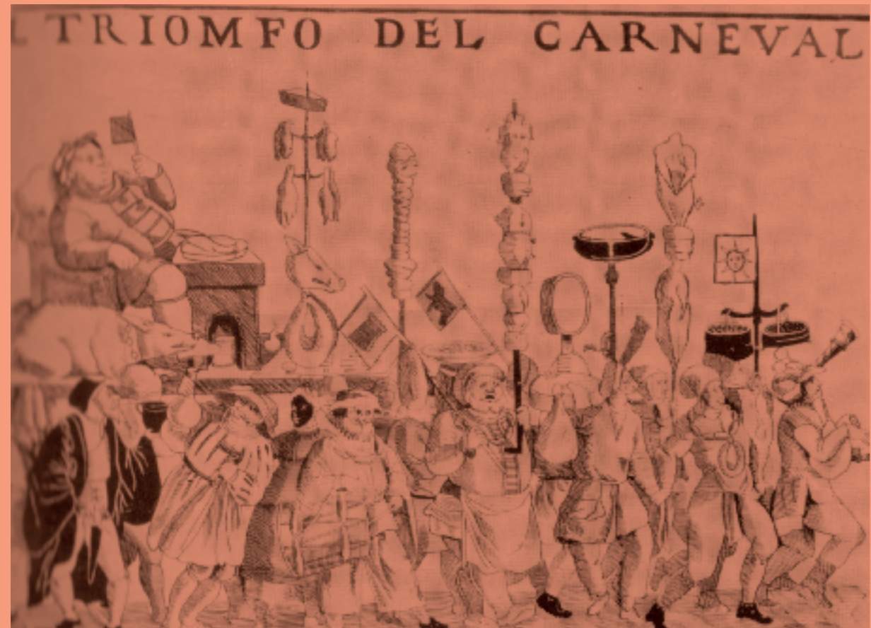
Il triomfo del carneval, uit: Le masque dans la tradition européenne (Binche, 1975)