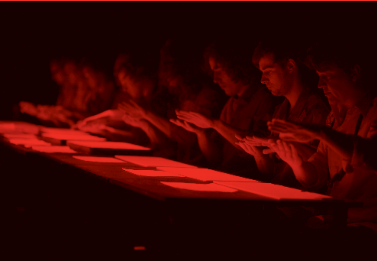
VU, Katrien Van Eschbrouck, 't Zand 34, 8000 Brugge